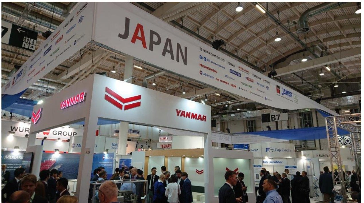
SMM ハンブルク 2018 展示会 Japan Pavilion の様子