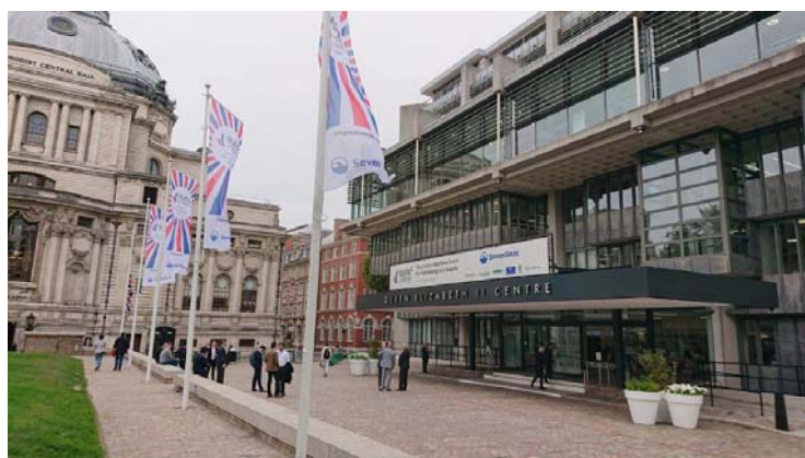
会場入り口の様子