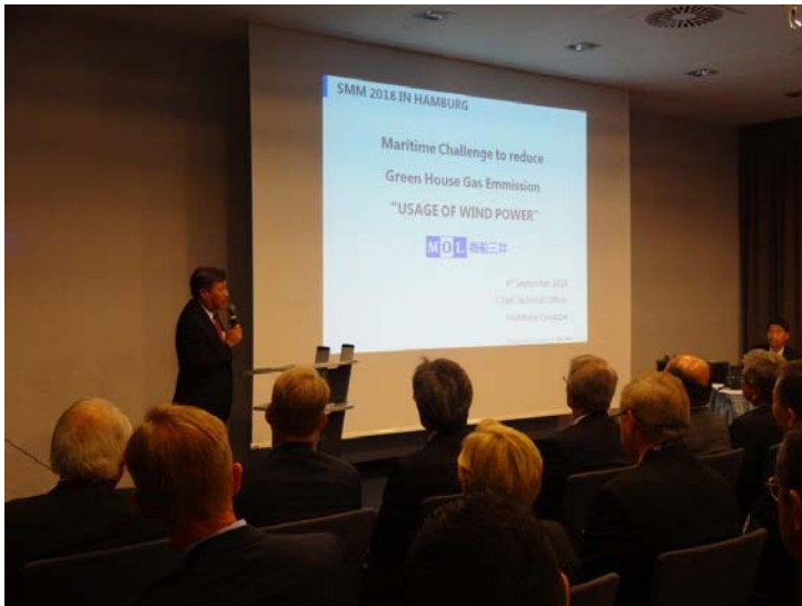
㈱商船三井 川越専務のご講演