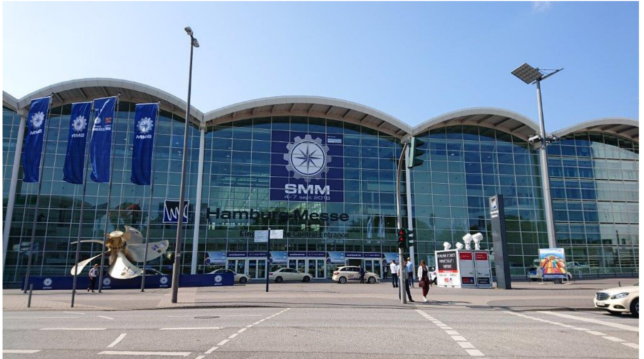
SMM ハンブルク 2018 展示会 会場の様子