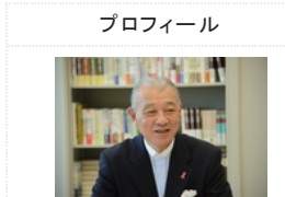
笹川 陽平 プロフィール ブログ