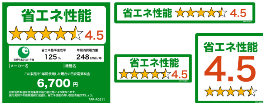
(冷蔵庫のイメージ)