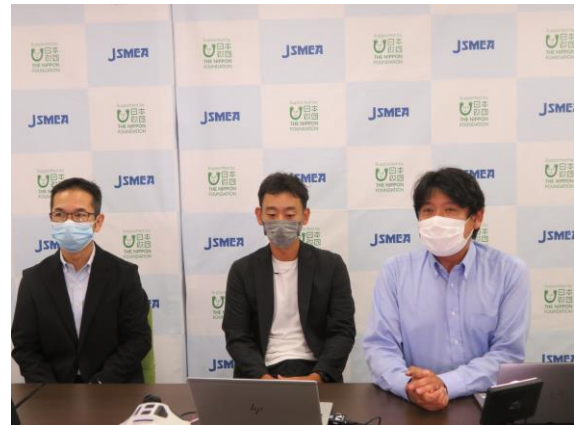
講演⑦ (KDDI 今村様・稲葉様・山下様)