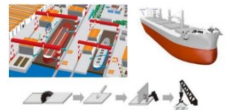
船舶の建造におけるDX