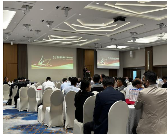
セミナーの様子(2023年開催時)