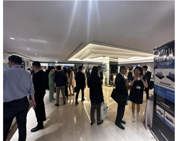
商談ブース様子(2023年開催時)