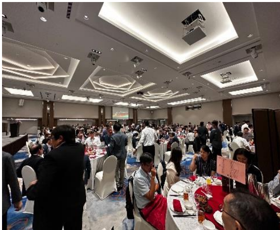
ディナーパーティーの様子(2023年開催時)