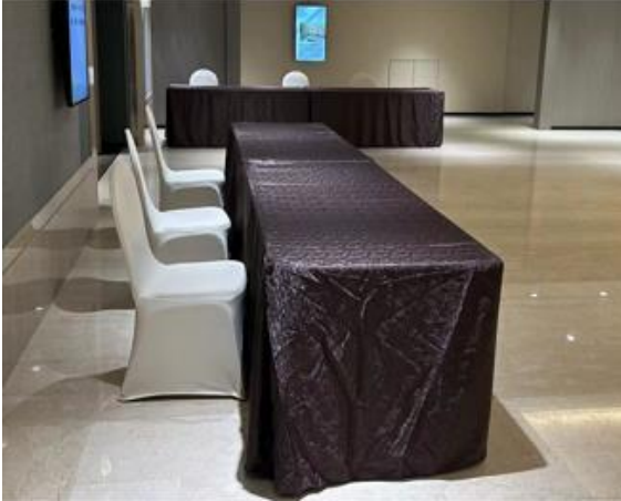
商談ブース(サイズ 180cm × 75cm)