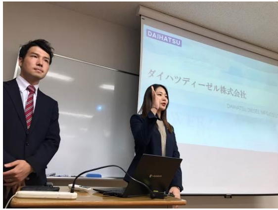
ダイハツディーゼルによる講演