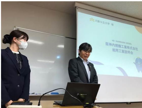
阪神内燃機工業による講演